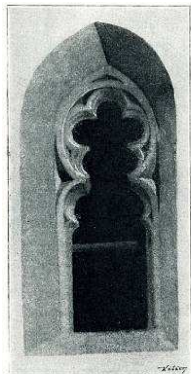
Obr. 88. Ratměřice. Zbytek kružby v kostelním okně

Svícný: dva bronzové, kroužené, pěkně profilované (0,29 m vys., 0,15 m průměr nohy), ze XVI. stol. a čtyři cínové na trojbokých hojně barokovým ornamentem ozdoběných podstavcích z konce XVII stol.